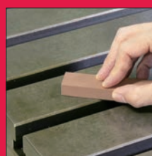
機械テーブル 机床工作台